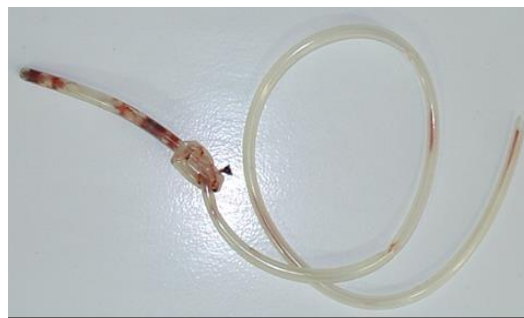
شکل ۱) یک گره ساده سفت در انتهای لوله بینی - معده

گره خوردن لوله بینی - معده هنگامی رخ می‌دهد که در ابتدا لوله در مسیر خود ایجاد یک حلقه (Coil) نموده و سپس انتهای دیستال لوله از درون این حلقه عبور کند. حال پس از ایجاد گره، به دنبال کشیدن لوله حین خارج سازی لوله بینی - معده گره ایجاد شده سفت‌تر و محکم‌تر می‌شود. گره خوردگی لوله بینی - معده می‌تواند به صورت ساده (Simple knot) یا به صورت حلقه کمند (Lariat loop) باشد (۱۵ و ۱۶). فاکتورهای متعددی جهت بروز گره خوردن لوله بینی - معده قید شده‌اند از جمله: نازک بودن قطر لوله (۱۷)، تغییرات آناتومیک از جمله کوچک بودن معده