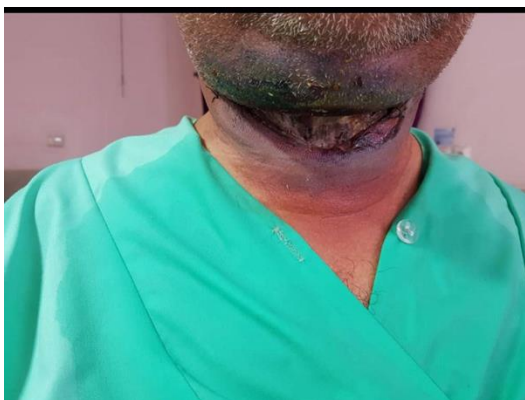
شکل ۳) پیشرفت شدید ادم گردنی و تغییر رنگ فلپ پوستی به صورت نکروز

لذا با تشخیص قبلی، آنتی‌بوتیک پنی‌سیلین و مترونیدازول شروع و بیمار به بخش گوش و حلق و بینی منتقل شد. پس از ۲۴ ساعت با توجه به پیشرفت شدید ادم گردنی و تغییر رنگ فلپ پوستی به صورت نکروز بیمار به اتاق عمل منتقل شد. (شکل ۳) و تحت دبریدمان بافت‌های نکروتیک قرار گرفت.