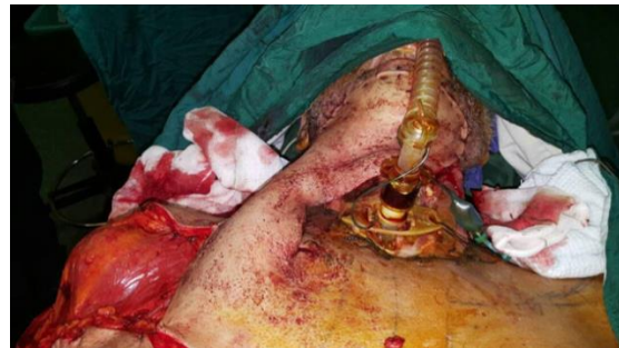
شکل ۵) پس از بازسازی با فلپ دلتوپکتورال

مرخص و در پیگیری یک و سه ماهه ضمن بازسازی موفق با فلپ هیچ آثاری از نکروز مشهود نبود. (شکل ۶)