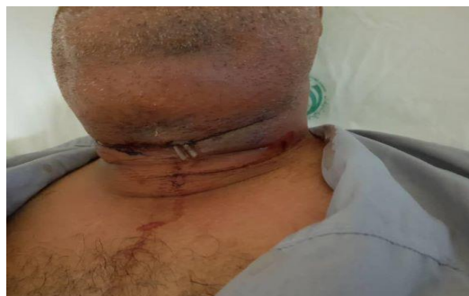
شکل ۱) نمای اولیه گردن بیمار، در هنگام مراجعه به بیمارستان خلیلی شیراز

گردنی گسترش یافته بود. در معاینه دهانی هیچ بیماری دندان‌های آشکاری مشهود نبود. محل انسزیون و درن ناشی از جراحی قبلی بدون شواهد خروج چرک مشهود بود. فلپ پوستی ضمن تورم سفت غیر گوده‌گذار به رنگ تیره، تغییر رنگ داده بود. (شکل ۱)