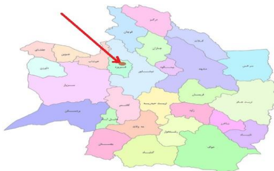
شکل (۱) نقشه جغرافیای معدن فیروزه نیشابور

پیش‌بینی می‌شود این معدن تا ۲۰۰ سال دیگر قابل استخراج باشد. در این معدن تا ۱۸ طبقه زیر زمین برداشت انجام می‌شود.