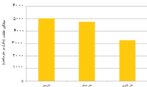
نمودار ۲) میانگین غلظت گاز رادون در سه غار (Bq/m 3 )