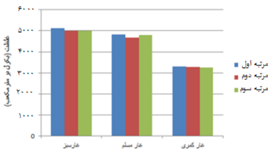
نمودار ۱) مقادیر غلظت اندازه‌گیری شده گاز رادون در سه غار در دفعات مختلف (Bq/m 3 )