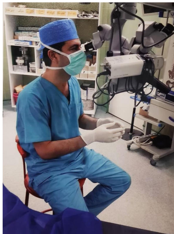
تصویر ۳) زنده یاد دکتر داراب مشتاقی در اتاق عمل

این ادبیات، شعر و موسیقی بود که او را سرشار از امید به زندگی کرده و او این اشتیاق به زندگی را در تنگ دره های روزمرگی زندگی به جریان انداخته بود و بدین سان آن فرزانه، به آتشفشانی از امید به جاودانگی بدل گشته بود. این عشق به زندگی و ستایش نیک ورزی ها و نظاره گری بر خوبی ها و چشم بر بستن از نجوای شیطان بود که در فلسفه زندگی اش همانند زکریای رازی،