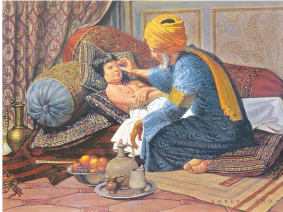
تصویر ۲) حکیم زکریای رازی، بزرگترین طبیب بالینی جهان اسلام

نکته جالب در همانندی این دو شخصیت بزرگوار آن بود که زنده یاد دکتر داراب مشتاقی، اورولوژیست بود و رازی نیز برجسته‌ترین نقش آوری‌های خود را دانش اورولوژی انجام داده بود؛ به گونه‌ای که او را پیشگام در دانش اورولوژی می‌شناسند. رازی از نشانه‌های بالینی بیماری‌های اورولوژیک مانند آبه‌های کلیه، آگاهی گسترده‌ای داشت و روش‌های گوناگون دارو درمانی را برای سنگ‌های مثانه و کلیه پیشنهاد کرده و روش Perineal Urethrotomy را برای برداشت سنگ‌های پیشابراه و نیز رفع تنگی آن پیشنهاد نمود (۴).