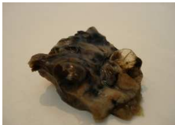
شکل ۴A. نمای ماکروسکوپی