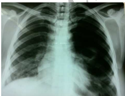
شکل ۱. پنوموتوراکس و کلاپس ریه سمت چپ

مراجعه کرد. بیمار چنین حملاتی را ماه قبل نیز داشت که با نصب لوله‌ی سینه‌ای بر طرف شده بود. بیمار شرح حال عود پنوموتوراکس را می‌داد. در رادیوگرافی قفسه‌ی سینه (شکل ۱) پنوموتوراکس و کلاپس ریه داشت. در HRCT انجام شده (شکل ۲) بولاهای متعدد دو طرفه دیده شد. در ضمن بیمار افیوژن پلور سروزی نیز داشت (شکل ۳).