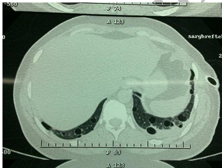
شکل ۳. پلورال افیوژن سروزی خفیف سمت چپ