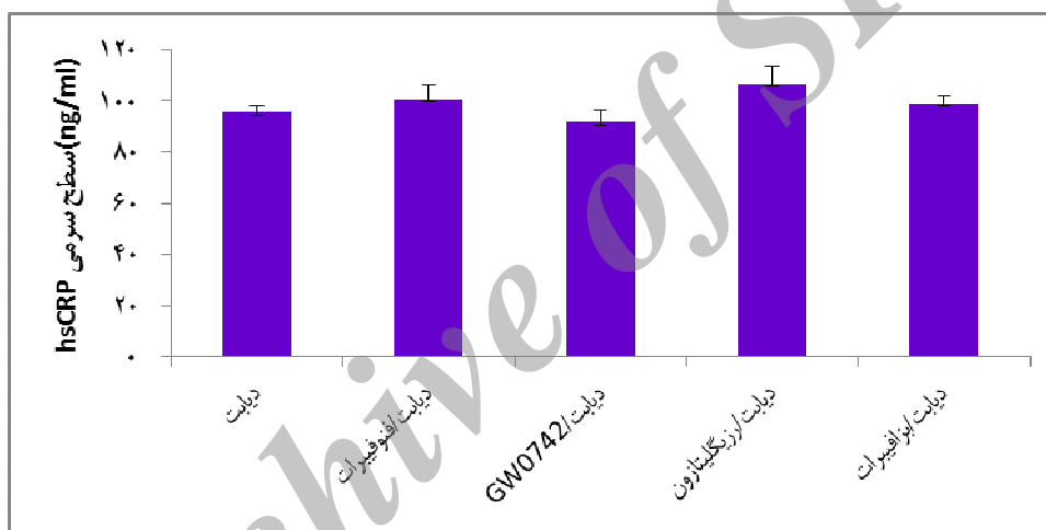
شکل ۱. سطح سرمی (High sensitive C-reactive protein) hsCRP در گروه‌های مختلف آزمایش

برای آنالیز داده‌ها از نرم‌افزار SPSS نسخه‌ی ۱۶ (version 16, SPSS Inc., Chicago, IL) استفاده گردید. داده‌های مطالعه با استفاده از آنالیز واریانس یک طرفه (One-way analysis of variance) یا (One-way ANOVA) و آزمون Posthoc LSD مورد تجزیه و تحلیل قرار گرفت. P کمتر از ۰/۰۵۰