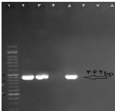
شکل ۳. بررسی محصول تکثیر ژن bla CITM توسط آگارز ژل الکتروفورز ستون ۱: DNA ladder (۵۰ bp). ستون‌های ۲ و ۳: جدایه‌های دارای ژن bla CITM (۴۶۲ bp). ستون‌های ۴ و ۵: به ترتیب شاهد منفی و مثبت برای bla CITM

تعداد ۱۹ ایزوله (۲۵/۳ درصد) تولید کننده‌ی ژن‌های AmpC بودند (شکل ۲). بر اساس نتایج ژن‌های bla CITM و bla DHAM به ترتیب در ۱۳ مورد (۱۷/۴ درصد) و ۲ مورد (۲/۷ درصد) ایزوله‌ها یافت شد (شکل‌های ۳ و ۴)، اما ژن bla FOXm یافت نشد.