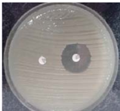
شکل ۲. بررسی جدایه‌ی تولید کننده‌ی AmpC به روش دیسک ترکیبی

مقاومت‌های آنتی‌بیوتیکی به عنوان یک معضل که منجر به ایجاد مشکلاتی در درمان می‌شوند، سلامت جامعه را به خطر می‌اندازند؛ به طوری که در دهه‌ی گذشته، با وجود تولید آنتی‌بیوتیک‌های جدید، انواع جدیدی از آنزیم‌های بتالاکتامازی مانند AmpC ظاهر شده‌اند که این آنزیم‌ها می‌توانند به باکتری‌های دیگر منتقل شوند و باعث افزایش مقاومت آنتی‌بیوتیکی، کاهش دارو و در نتیجه عفونت‌های جدی شوند (۱۱).