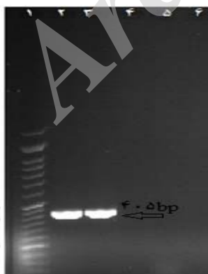
شکل ۴. بررسی محصول تکثیر ژن bla DHAM توسط آگارز ژل الکتروفورز

جدایه‌های مورد بررسی، کمترین مقاومت را به ترتیب نسبت سفوکسیتین (۵/۸ درصد)، جنتامایسین (۱۶/۷ درصد)، سفنازیدیم (۲۳/۳ درصد)، سیپروفلوکساسین (۳۵/۰ درصد)، سفپیم (۳۸/۳ درصد)، سفتریاکسون (۴۵/۸ درصد)، سفوتاکسیم (۴۸/۳ درصد)، نالیدیکسیک اسید (۵۶/۷ درصد)، تری متوپریم- سولفامتاکسازول (۶۳/۳ درصد) و آموکسی سیلین (۷۸/۳ درصد) نشان دادند. شیوع مقاومت آنتی‌بیوتیکی در مطالعات مختلف متفاوت است. حسینی و همکاران در یزد، میزان مقاومت برای آنتی‌بیوتیک‌های نالیدیکسیک اسید و سیپروفلوکساسین در نمونه‌های Escherichia coli مولد عفونت ادراری را به ترتیب ۷۳/۴ و ۵۳/۲ درصد گزارش کردند (۱۲).