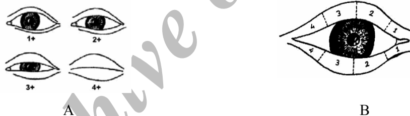
تصویر ۱- درجه بندی میزان ادم (A) و اکیموز (B) اطراف چشم

تمام موارد جراحی، جراحی به روش باز بود. متوسط سن گروه های سه گانه به ترتیب ۲۱/۲، ۲۲/۳ و ۲۱/۶ سال بوده و هر گروه شامل ۱۵ نفر زن و ۵ نفر مرد بود. جدول میزان کبودی و تورم اطراف چشم پس از عمل برای تمامی بیماران تهیه شد.