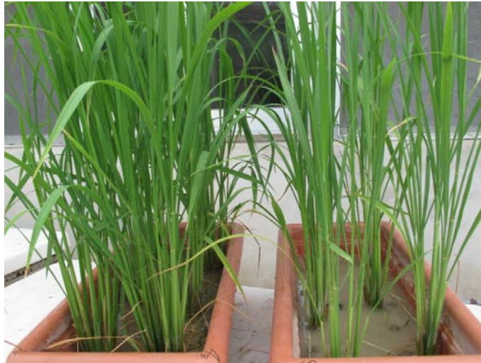
شکل ۱. تأثیر اندومیکوریز Piriformospora indica روی گیاهان تیمار شده برنج (سمت چپ) در مقایسه با شاهد (سمت راست) Fig. 1. Effect of endomycorrhizal fungus Piriformospora indica on rice plants (left) in comparison to control (right)