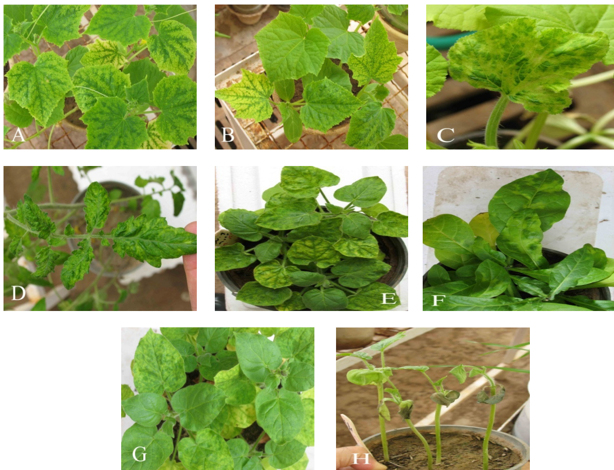
شکل ۲. علائم گیاهان مایه‌زنی شده با سازه عفونت‌زای ویروس پالامپور پیچیدگی برگ گوجه‌فرنگی شامل زردی فاصله رگبرگ‌ها در بوته‌های خیار گلخانه‌ای رقم هیبرید اکستریم (A و B)، موزائیک، زردی و کوچک شدن برگ در کدو رقم مراغه (C)، لکه‌های سبزدرد، ریز برگ‌گی و پیچیدگی برگ‌ها به سمت پایین در گوجه‌فرنگی رقم Queen (D)، لکه‌های سبزدرد در گونه‌های توتون (E) Nicotiana glutinosa رقم N. debneyii (F)، N. clevelandii (G) و نکروز برگ‌ها در هندوانه رقم Crimson sweet (H).

Fig. 2. ToLCPMV agroinoculated plants showing vein banding and yellowing on cucumber variety Extreme hybrid (A and B), mosaic, yellowing and reduced size leaf on squash variety Maragheh (C), chlorotic spots, fine leaf and leaf curling toward down on tomato variety Queen (D), chlorotic spots on three tobacco species, Nicotiana glutinosa , N. debneyii and N. clevelandii (E, F and G, respectively) and leaf necrosis reaction on watermelon variety Crimson sweet (H).