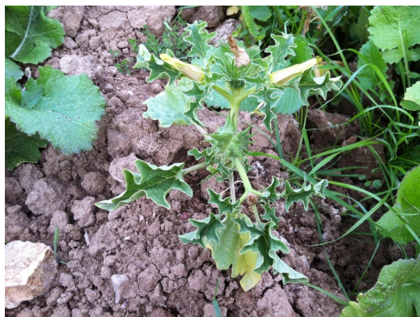
شکل ۱. علائم ناشی از ویروس پیچیدگی برگ شلغم شامل زردی عمومی و فنجان‌ی شدن شدید برگ‌ها در گیاه تاتوره ( Datura stramonium ) جمع‌آوری‌شده از منطقه لپوئی (۲۵ کیلومتری شمال شرقی شیراز، استان فارس).

از آنجائی که محصول واکنش پی‌سی‌آر فاقد انتهای چسبیده می‌باشد، بنابراین قطعه تکثیرشده با اندازه تقریبی ۳ kb با استفاده از کیت CloneJET PCR Cloning Kit (Thermo Fisher Scientific, USA) در پلاسمید pJET1.2 با انتهای صاف (blunt) و طبق دستورالعمل شرکت سازنده همسانه‌سازی گردید. برای انتقال پلاسمید