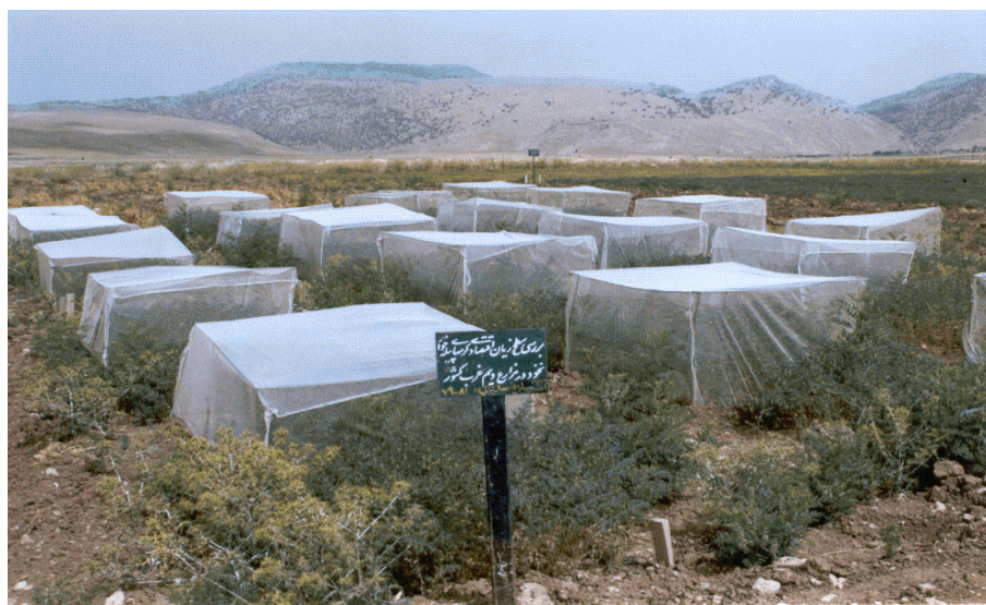
شکل ۱. نمایی از نحوه‌ی اجرای طرح بررسی سطح زیان اقتصادی کرم‌های پبله‌خوار نخود در استان ایلام.