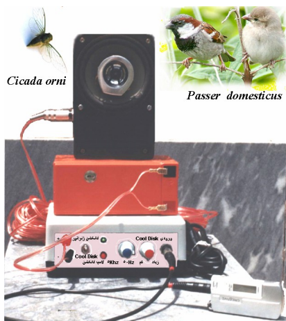
شکل ۱. دستگاه صوتی طراحی شده.

آزمایش از اوایل اردیبهشت تا اواخر خرداد از زمان طلوع خورشید تا چند ساعت بعد از آن تعیین شد که پرندگان حدود ۱ تا ۵ دقیقه بعد از پخش امواج صوتی جلب گردیدند (شکل ۲).