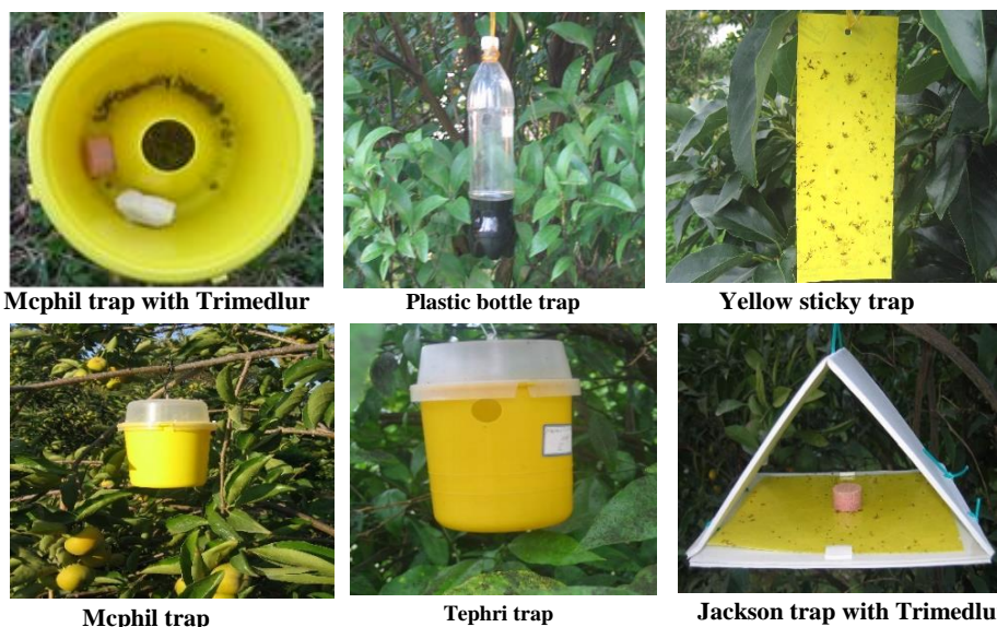
شکل ۱- تله‌ها و ترکیبات جلب‌کننده مورد استفاده برای پایش مگس میوه مدیترانه‌ای در استان مازندران، ۱۳۸۶ و ۱۳۸۷.

تله‌ها به فواصل تقریبی ۳۰ الی ۵۰ متر از یکدیگر، در ارتفاع ۱۵۰-۲۰۰ سانتی‌متر از سطح زمین، در بخش جنوبی و اندکی در سایه انداز درختان نصب شدند. تله‌ها هر ۵ تا ۷ روز بازدید شده و تعداد حشرات نر و ماده شکار شده به صورت جداگانه و بر اساس نوع تله و ماده جلب‌کننده شمارش و ثبت شدند. مواد جلب‌کننده سراترپ و پروتئین هیدرولیزات به فاصله ۲ تا ۳ هفته تعویض شدند (شکل ۱).