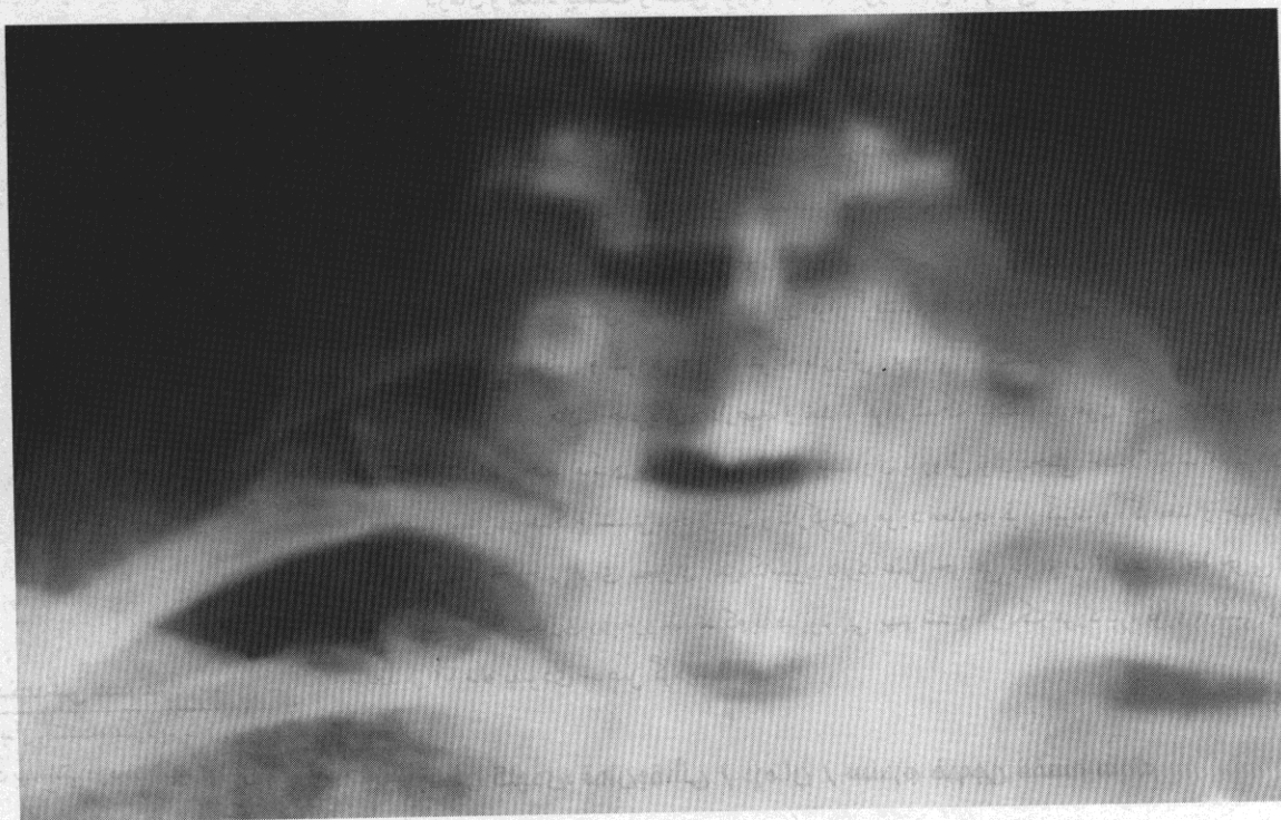
شکل ۲- باندد لت فیروزه متصل شده به انتهای دنده گردنی باعث فشار روی شبکه بازویی می‌شود.