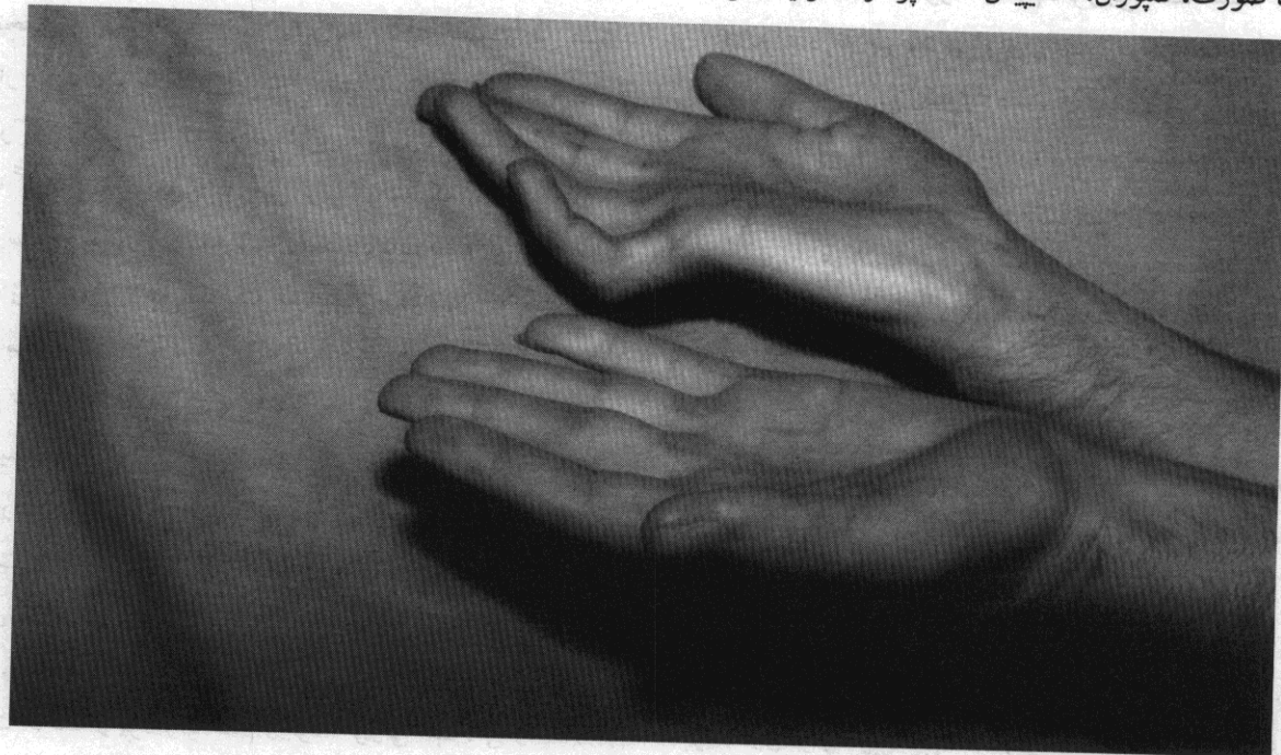
شکل ۳- به علت سندرم خروجی قفسه سینه عضلات دست راست نسبت به دست چپ ضعیف‌تر شده و علائم Ulnar Claw Hand در دست راست مشخص می‌باشد.

هیپرتروفی و اسپاسم اسکالن قدامی، اسپاسم اسکالن میانی ثانوی به تروما، پوزیسیون‌های غیرطبیعی، تغییرات آناتومی دنده مثل کج و شیب‌دار شدن دنده اول، وجود فاشیای سیسون می‌تواند عامل فشار روی شبکه بازویی باشد. علائم عصبی، عروقی و یا مشترک می‌باشد، ولی بیش‌تر بیماران در حدود ۹۰-۹۵٪ با علائم عصبی به پزشک مراجعه می‌کنند. در صورتی که فشردگی روی کوردهای فوقانی باشد، درد به اشکال مختلف خود را نشان می‌دهد که می‌تواند در قسمت فوقانی قفسه صدری، قدام و طرفین گردن، ماندیول، صورت، تمپورال، اکسیپیتال، اسکاپولار، دلتوئید، لترال