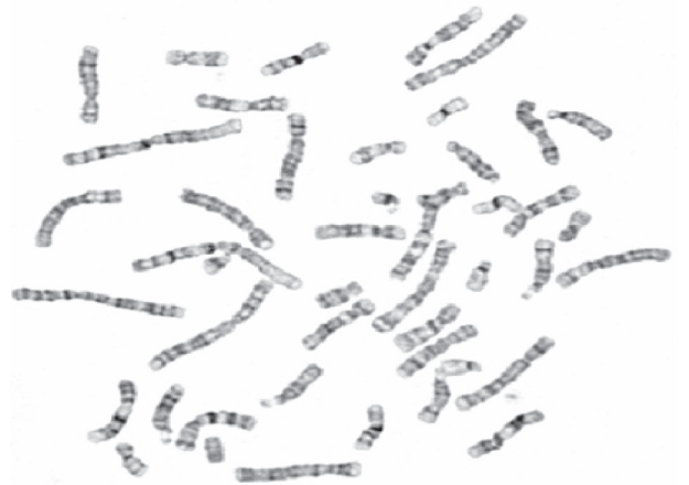
شکل ۲- گستره متافازی طبیعی

این تحقیق بر آن است تا با متمرکز شدن بر روی استان گلستان (یکی از استانهای شمالی کشور) علل عقب‌ماندگی ذهنی ژنتیکی را در این استان مورد بررسی قرار دهد، تا بدین وسیله پزشکان و مشاورین ژنتیک بتوانند با انجام مشاوره ژنتیک صحیح‌تر نسبت به پیشگیری و کنترل این عارضه اقدامات منطقی‌تری انجام دهند.