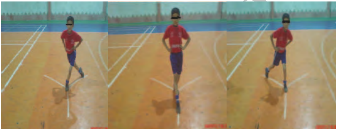
شکل ۱. روش اندازه‌گیری تعادل پویا

قدامی فوقانی تا فوزک داخلی در حالت خوابیده به حالت طاق باز روی زمین اندازه‌گیری شد (۱۴). هر آزمودنی شش بار آزمون را تمرین کرد تا روش اجرای آن را فراگیرد. آزمودنی در مرکز محل تست، روی یک پا ایستاده و با پای دیگر در جهتی که آزمونگر انتخاب می‌کرد، عمل دستپایی حداکثری را بدون خطا انجام می‌داد و به حالت اولیه برمی‌گشت. به منظور از بین بردن اثر یادگیری، هر آزمودنی هریک از جهت‌ها را شش بار و هر دفعه با پانزده ثانیه استراحت تمرین می‌کرد. بعد از پنج دقیقه استراحت، آزمودنی