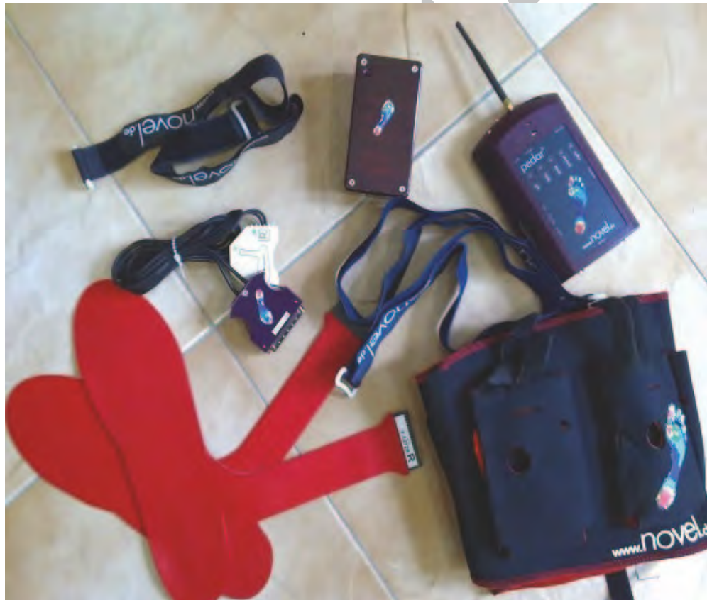
شکل ۲. بخش سخت‌افزاری دستگاه

برای تعیین سطح دفورمیتی، در وضعیت تحمل وزن، مقیاس منچستر در کنار پای فرد بررسی می‌شد و معاینه‌گر آن را مقایسه می‌کرد. براساس تشابه پای فرد به هر یک از عکس‌های مقیاس منچستر، سطح دفورمیتی مشخص می‌شد (۱۴). پایایی این مقیاس را منز ۱ و همکاران از طریق عکس رادیولوژی تعیین کردند. آن‌ها مشخص کردند ضریب هم‌بستگی این مقیاس، با زاویه هالوکس ولگوس ۷۳ درصد و با زاویه ایترمتاتارسال ۴۹ درصد به دست آمده از عکس‌های رادیوگرافی مرتبط است. همچنین در مطالعه‌ای دیگر، پایایی و روایی این مقیاس برای استفاده در پرسش‌نامه تأیید شده است (۱۶-۱۴). اطلاعات لازم از طریق سؤالات حضوری و پرسش‌نامه ثبت و