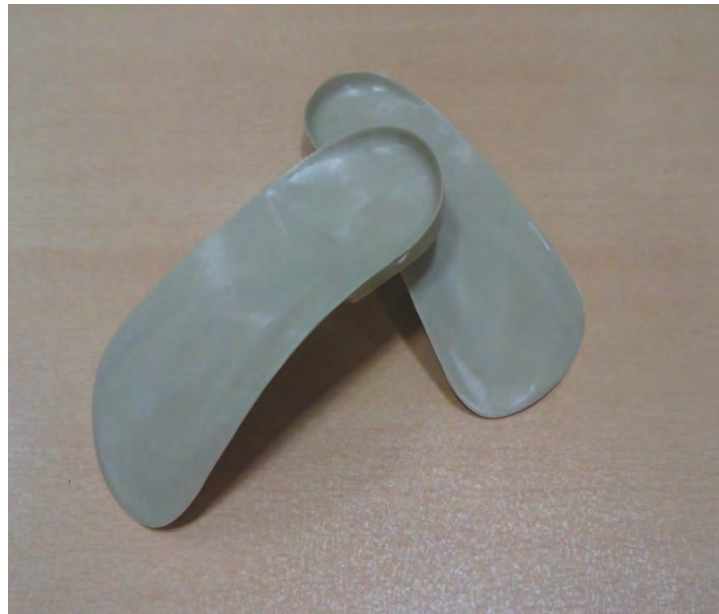
شکل ۳. ارتز دارای حمایت قوس طولی داخلی

پس از جمع‌آوری اطلاعات با کمک نرم‌افزار تجزیه و تحلیل گام، تا پنجم، میانی داخلی، میانی خارجی و پاشنه تقسیم‌بندی شد کف پا به هشت منطقه آناتومیکی شامل انگشت اول، انگشتان دوم تا پنجم، متاتارس اول، متاتارس دوم، متاتارس‌های سوم