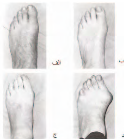
شکل ۱. الف. سالم؛ ب. خفیف؛ ج. متوسط؛ د. شدید.

بدشکلی هالوکس ولگوس ۱ از متداول ترین اختلالات پنجه پاست که ناشی از انحراف خارجی انگشت شست به همراه انحراف داخلی اولین استخوان متاتارس ۲ بوده و معمولاً با درد در ناحیه اولین مفصل متاتارسوفالانژیال ۳ همراه است. در مطالعات شیوع این عارضه، ۲۳ درصد در افراد ۱۸ تا ۶۵ سال و ۳۵/۷ درصد در افراد بیش از ۶۵ سال گزارش شده است (۱). در این بدشکلی، اولین مفصل متاتارسوفالانژیال از راستای طبیعی خود منحرف شده و ممکن است دچار نیمه دررفتگی شود. این امر سبب برهم خوردن ساختار طبیعی و زیبایی پنجه پا، دردناک شدن این منطقه، تغییر توزیع فشارهای کف پای و اختلال در راه رفتن می شود (۲). درمان هالوکس ولگوس، با هدف کاهش درد، تصحیح نیروهای وارد بر اولین مفصل متاتارسوفالانژیال، بازگردانی قدرت عضلانی و بهبود توزیع فشارهای کف پا انجام می شود (۲). یکی از درمان های اولیه در مراحل ابتدایی این عارضه درمان محافظتی است که شامل استفاده از اسپلینت ها و ارتز جداکننده انگشتان و همچنین ارتز دارای بخش حمایت قوس کف پای است (۴-۲). براساس مطالعات، به کارگیری ارتز دارای حمایت قوس طولی ممکن است با حمایت قوس طولی، باعث ثبات پا، حفظ قوس کف پا، کاهش تنش وارد بر بافت، کاهش گشتاور و لگوسی و تنش های وارد بر اولین مفصل متاتارسوفالانژیال شود (۶، ۵، ۲). در بیشتر مطالعات ارتزی، ارزیابی آثار ثانویه ارتز مانند کاهش درد و ارتقای سطح زندگی، از طریق پرسش نامه یا عکس رادیوگرافی بررسی شده است و در زمینه تأثیر بیومکانیکی ارتز از نظر توزیع فشار کف پای در این افراد، اطلاعات چندانی در دسترس نیست (۱۰-۷، ۲). از سوی دیگر، مطالعات نشان می دهد توزیع فشار کف پا در افراد