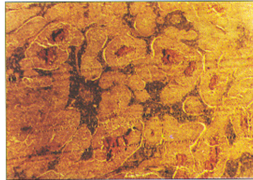
شکل ۱- در بزرگنمایی با عدسی ۲/۵، ضخامت سلولهای تومور با مراکز نکروزه مشهود است

جواب آسیب‌شناسی مویذنوپلاسم آناپلاستیک بدخیم وسیع با تهاجم وسیع لنفاویک به سرویکس گزارش شد.