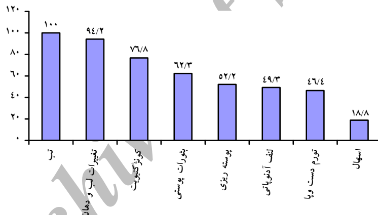
نمودار شماره ۱- درصد فراوانی علائم بالینی در کودکان مبتلا به کاوازاکی مورد مطالعه

۱۰۰ درصد کودکان مبتلا به کاوازاکی دارای تب بوده و پس از آن تغییرات لب و دهان (۹۴/۲ درصد) و کونژکتیویت (۷۶/۸ درصد) شایع‌ترین علائم بالینی در مبتلایان به کاوازاکی بودند. بشورات پوستی (۶۲/۳ درصد)، پوسته ریزی (۵۲/۲ درصد)، لنفادنوپاتی