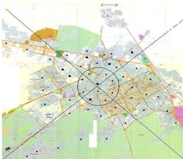
شکل شماره ۱- نقاط انتخاب شده برای اندازه‌گیری تابش گاما در مناطق جغرافیایی پنج‌گانه شهر کاشان (نقاط سیاه)