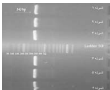
شکل شماره ۲- بررسی طول قطعات تکثیر شده در کنار DNA Ladder 50: طول قطعه در نمونه های ۱ تا ۶ که محصول PCR هستند ۳۴۳ جفت باز می باشد.