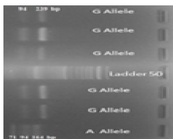
شکل شماره ۳- الکتروفورز ژل آگاروز محصول PCR پس از مواجهه با آنزیم HinI II در کنار DNA Ladder 50bp. آلل G دو قطعه و آلل A سه قطعه ایجاد کرده است.

با بافر B19 به میزان ۱ به ۹ رقیق شده و سپس طبق جدول زمانی و دمایی شماره ۲ محصولات PCR با آنزیم مذکور مجاور گردید. سپس، بر اساس جداول شماره ۳ و ۴ پروتکل و برنامه PCR اجرا گردید. به منظور ارزیابی وضعیت برش محصولات PCR طبق شکل شماره ۳ روی ژل آگاروز ۲ درصد در کنار DNA Ladder 50bp الکتروفورز انجام گردید. بعد از بررسی تک تک افراد از نظر ژنوتیپ، داده ها با استفاده از نرم افزار آماری SPSS ویرایش ۲۳ مورد تجزیه و تحلیل قرار گرفتند. فراوانی ۳ حالت هموزیگوت سالم، هتروزیگوت و هموزیگوت جهش یافته در دو گروه سالم و شاهد برای این چند شکلی ها با استفاده از آزمون آماری مجذور کای مورد بررسی قرار گرفت و نتایج به دست آمده با سطح معنی داری کمتر از ۰/۰۵ مقایسه شد.