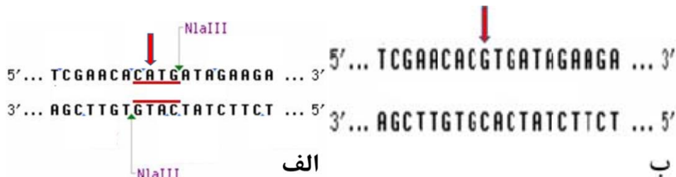
شکل شماره ۱- الف: آل A برش با آنزیم، ب: آل G، عدم برش با آنزیم

Hin1 III (یا آنزیم NlaIII) قابل شناسایی می‌باشد و همان‌طور که در شکل شماره ۱ (الف و ب) مشاهده می‌گردد، محل شناسایی آنزیم Hin1 II توالی CATG بوده و محل برش آن نوکلئوتید G توالی مذکور می‌باشد که در واقع نوکلئوتید شماره ۱۹۶ ژن BDNF خواهد بود. چنانچه نوکلئوتید G تبدیل به نوکلئوتید A شود، توسط آنزیم مذکور برش می‌خورد. از آنجایی که بررسی پلی- مورفیسم ژن مذکور در جمعیت آذربایری در ایران در هیچ مطالعه- ای تاکنون صورت نگرفته، به نظر می‌رسد این مطالعه ضروری بوده و بتواند اطلاعاتی از پیش‌آگهی بیماری و استعداد ابتلا به آن را در اختیار پزشکان قرار دهد. همچنین، بررسی فاکتورهای ایجاد خطر در پیش‌بینی ابتلا به آلزایمر در افراد دارای سابقه فامیلی یکی از مواردی است که ضرورت تحقیق را ایجاب می‌کند.