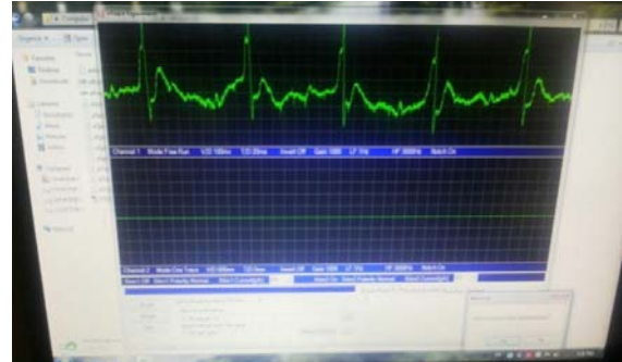
شکل شماره ۱- الکتروکاردیوگرام موش صحرائی سالم (سمت راست) و مبتلا شده به انفارکتوس میوکارد (سمت چپ)

موش صحرائی به صورت تصادفی انتخاب شد و تحت شرایط آزمایش جهت القای انفارکتوس میوکارد قرار گرفت. انفارکتوس قلبی بر اساس علائم بالینی و تغییرات الکتروکاردیوگرافی (بالا رفتن قطعه ST که با دستگاه ELab و نرم‌افزار eprobe مؤسسه پرتو دانش ثبت شد) همراه با افزایش آنزیم‌های قلبی مانند مارکر تروپونین قلبی (cardiac Troponin I) cTnI که بالاترین