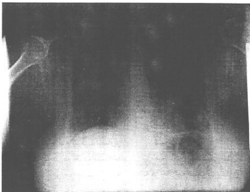
شکل ۲- تصویر رادیوگرافیک بیمار