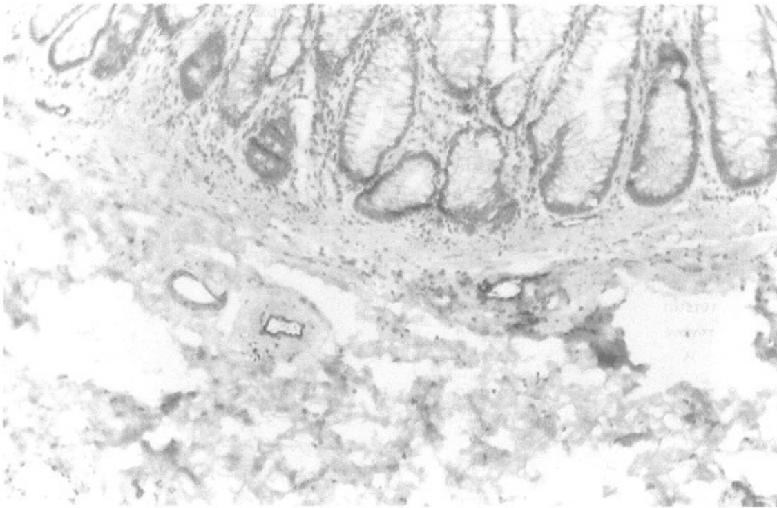
تصویر ۱- نمای عروق در جدار سالم کولون در بزرگ‌نمایی \times 100