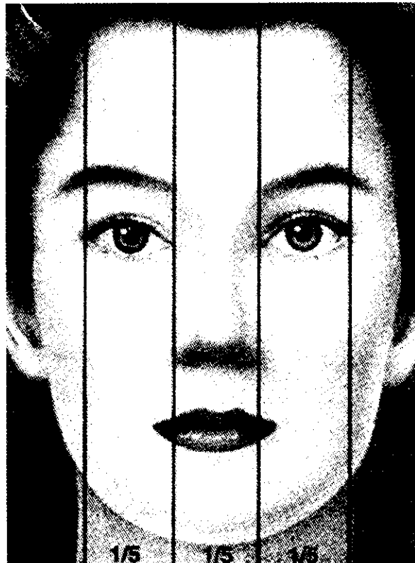
شکل شماره ۱- پهنای صورت: براساس پهنای صورت نرمال که مساوی ۵ فاصله اینترکانتال می‌باشد

استخوان بینی در ناحیه base در ۱۸ بیمار ۲۱/۹٪ طبیعی، در ۲۳ بیمار (۲۸٪) پهن ۳۹ (۴۷/۵٪) باریک ۲ و در ۲ بیمار ۲/۴٪ منحرف بود.