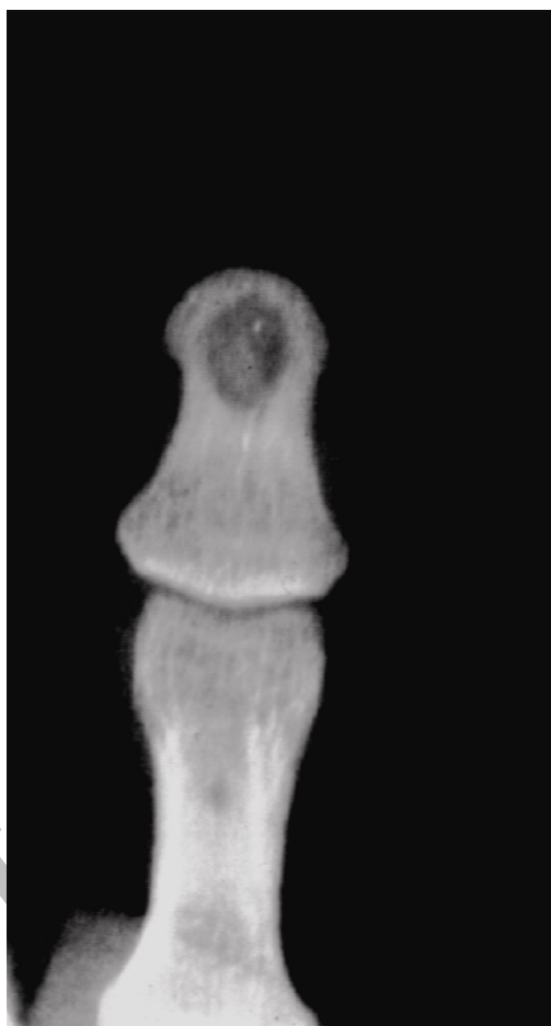
شکل ۳- ضایعه لیتیک در بند دیستال. تشخیص قبل از عمل اپیدرموئید کیست بوده است.