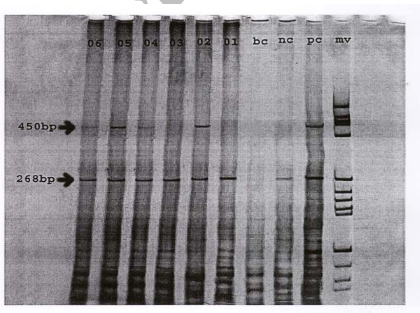
شکل ۲- یک نمونه از ژل پلی‌اکریل‌آمید

ضایعات دهانه رحم ۷۰٪ گزارش شد که البته در آن مطالعه از روش هیبریداسیون ملکولی In-Situ استفاده شده بود. مطالعات اپیدمیولوژیک مهم‌ترین عوامل خطر برای ایجاد سرطان دهانه رحم، بعد از HPV را: (۱) سن پایین بهنگام اولین مقاربت، (۲) وجود شرکای جنسی متعدد و (۳) تعدد مقاربت می‌دانند؛ در ادامه از عوامل دیگر می‌توان به موارد ذیل اشاره نمود: (۴) تعداد بارداری‌ها و پیدایش اولین بارداری در سنین پایین و قبل از ۱۸ سالگی، (۵) تماس جنسی با مردان پرخطر (مردانی که با زنان متعدد تماس جنسی دارند)؛ (۶) مصرف قرص‌های