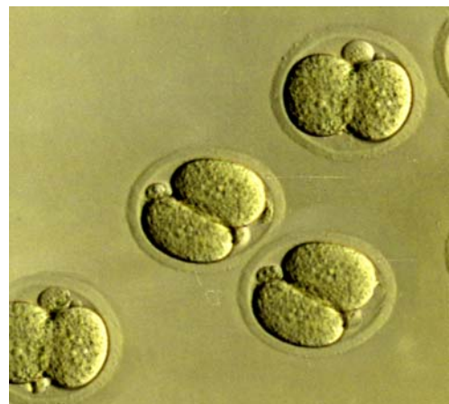
تصویر-۱: جنین‌های به‌دست آمده در مرحله دو سلولی.

جهت IVF نمونه‌های اسپرم به مدت دو ساعت در داخل انکوباتور CO_2 انکوبه شدند تا ظرفیت‌پذیری را به‌دست آورند. آنگاه، اووسیت‌های مرحله متافاز II را در قطرات محیط کشت T6 قرار داده و اسپرم‌ها افزوده شده و به مدت ۴-۶ ساعت در انکوباتور CO_2 انکوبه شدند. سپس اووسیت‌ها جهت شستشو به محیط کشت جدید منتقل گردیدند تا اووسیت‌های لقاح یافته در محیط کشت جدید حاوی مواد غذایی کافی رشد نموده و به مرحله دو سلولی برسند. در نهایت در صبح روز بعد تعداد جنین‌های دو سلولی را شمارش نموده و از این طریق میزان لقاح در هر یک از گروه‌های آزمون و کنترل محاسبه گردید (تصویر شماره ۱). برای مقایسه گروه‌های آزمون با گروه کنترل از نرم افزار SPSS و آزمون آماری t-test استفاده شد.