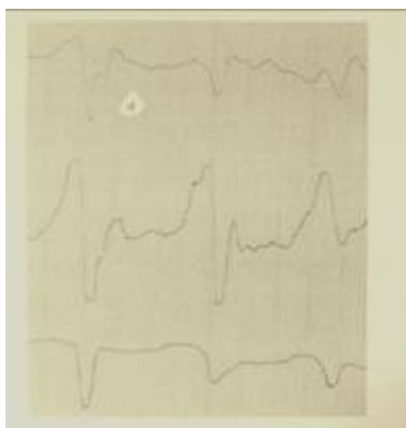
شکل-۱: EEG در حالت بیداری

در پاراکلینیک: CBC و الکترولیت‌ها و تست‌های کبدی و کلیوی نرمال بود. HIVAb, RPR, Wright و 2ME نرمال بود. سطح Vit B 12 نرمال بود. آنالیز CSF نرمال و PCR آن برای توپرکلوزیس منفی بود. ESR ساعت اول ۲۴ mm بود. گرافی قفسه سینه و ECG نرمال بود. در EEG Periodic sharp wave's وجود داشت که هر چند ثانیه یک بار تکرار می‌شد. (تصویر شماره ۱). در MRI مغزی هیپرسیگنالیتی سر caudate و پوتامن دو طرف در نمای T2 و FLAIR و DWI ملاحظه شد (تصویر شماره ۲ نمای DWI را نشان می‌دهد). تشخیص بیماری بر اساس شرح حال و علائم بالینی و سیر بیماری و نمای EEG و نیز نمای تیپیک MRI مغزی داده شد. سایر علل دمانس پیشرونده مانند کمبود ویتامین B12، عفونت‌های مغزی (قارچی، گرانولوماتوز و غیره) رد شد. بیماری سیر پیشرونده داشت و بیمار متأسفانه یک‌ماه پس از تشخیص فوت نمود.