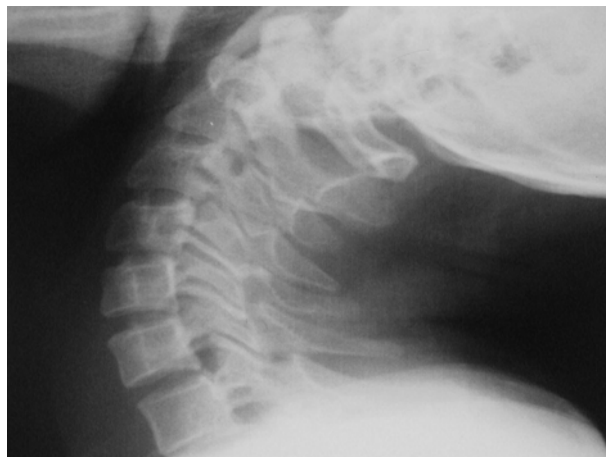
شکل- ۱: رادیوگرافی لاترال گردن بیمار