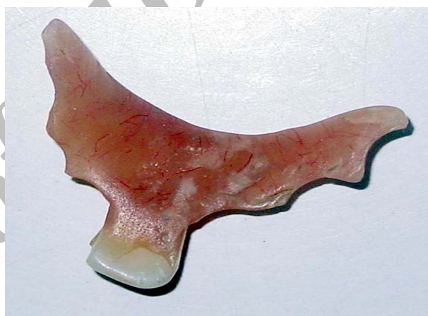
شکل- ۳: تصویر پروتز دندانانی بیمار خارج شده از مری

جهت رد فیستول بین عروق گردنی و توراسیک و مری آنژیوگرافی از قوس آئورت و عروق کاروتید در گردن انجام شد که باز هم محل خونریزی مشخص نشد. شکل ۴ آنژیوگرافی بیمار را نشان می‌دهد. در ادامه درمان بیمار مجدداً در بخش دچار خونریزی شدید گوارشی شد. در این نوبت بر خلاف دفعات قبلی از همکاران آندوسکوپیست تقاضا شد که در فاز حاد خونریزی آندوسکوپی در اتاق عمل و تحت بیهوشی عمومی انجام شود که در این نوبت انجام آندوسکوپی محل خونریزی از مری گردنی در زاویه مقابل محل ترمیم به صورت خونریزی نبض دار رؤیت شد که بلافاصله بیمار تحت اکسیپوراسیون گردن از سمت چپ قرار گرفت و مری از محل ازوفاجوتومی قبلی باز شد، محل خونریزی در حدود ۴cm از اسفنکتر فوقانی مری قابل رؤیت بود که خونریزی نبض دار داشت. سپس در ارزیابی بیشتر مشخص شد که محل خونریزی از انشعابات شریان تیروئیدی به مری