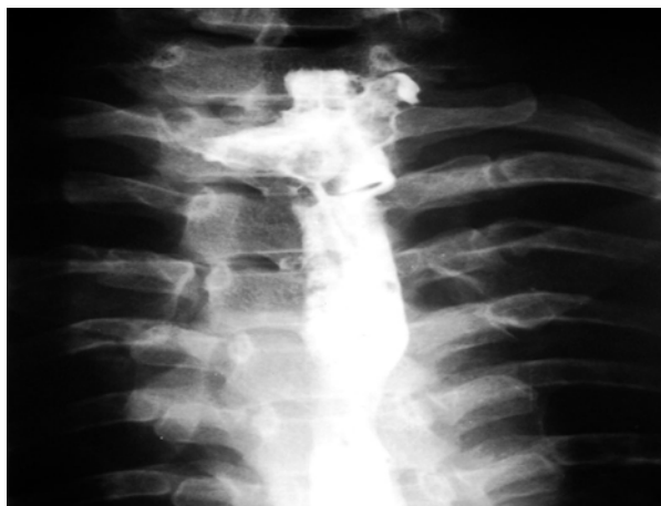
شکل- ۲: بلع باریم با نامنظمی مری گردنی مشکوک به نشت ماده حاجب