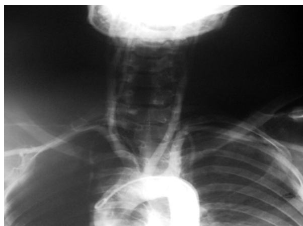
شکل- ۴: نمای آنژیوگرافی قوس آئورت و عروق کاروتید