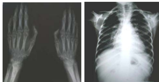
شکل ۳: عکسهای رادیولوژی بیمار

با توجه به یافته‌های بالینی خاص بیمار شامل کوتاهی قد، آترواسکلروز زودرس و ظاهر پیر (premature aging) در بانک اطلاعاتی Medline با استفاده از کلمات کلیدی فوق جستجو صورت گرفت. تشخیص‌های احتمالی شامل سندرم‌های \text{HGPS} , Werner و \text{Metageria} مطرح می‌باشند. قندهای ناشتای طبیعی، کوتاهی قد قابل توجه، استئولیز، بیماری قلبی در سنین پایین، عدم وجود کاتاراکت و عدم سابقه خانوادگی بیماری مشابه بر علیه تشخیص سندرم ورنر می‌باشد. کوتاهی قد، عدم وجود دیابت، عدم وجود ضایعات پوستی \text{Poikiloderma} و عدم وجود علائم ایسکمی اندام‌ها در این بیمار برخلاف تشخیص سندرم متاجریا می‌باشد. با توجه به تطابق یافته‌های بالینی با موارد مشابه تشخیص بیماری براساس شجره‌نامه و شرح حال بیمار و یافته‌های بالینی و آزمایشگاهی به نفع \text{HGPS} می‌باشد. ۳ شیوع سندرم پروجریا هوچینسون گیلفورد، یک در هشت