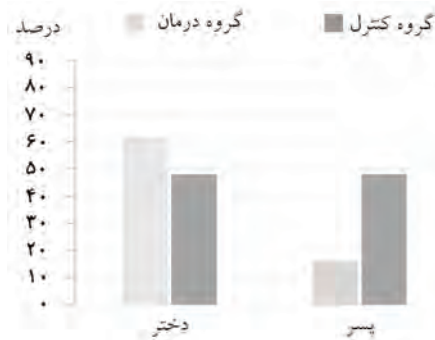
نمودار-۱: توزیع متغیر جنس در گروه‌های درمان و کنترل در افراد چهار تا شش ساله با فلج مغزی نیمه بدن ساکن تهران (سال ۱۳۸۷)