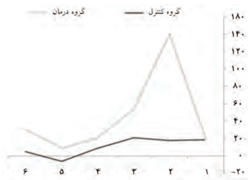
نمودار-۲: مقایسه اثرات درمانی بر دو گروه درمان و کنترل با استفاده از مقیاس رشد حرکتی پی‌بادی (PDMS) در افراد چهار تا شش ساله با فلج مغزی نیمه بدن ساکن تهران (سال ۱۳۸۷)