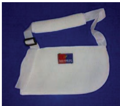
شکل - ۲: نمونه‌ای از اسلینگ مورد استفاده در این مطالعه

از مداخله وجود نداشت ( p > 0.05 ) (آزمون‌ها عبارتند از: مقیاس‌های رشد حرکتی پی‌بادی، مقیاس اصلاح‌شده اشورت در مفصل شانه، مقیاس اصلاح‌شده اشورت در مفصل آرنج، مقیاس اصلاح‌شده اشورت در مفصل میچ دست، بازتاب H و نسبت H/M در اندام فوقانی). میانگین و انحراف معیار متغیر مقیاس‌های رشد حرکتی پی‌بادی (PDMS) در گروه کنترل، پیش و پس از مداخله به ترتیب (493/33 \pm 18/27) و (504/33 \pm 26/75) بود، اختلاف مشاهده شده میان میانگین PDMS پیش و پس از مداخله در گروه کنترل معنی‌دار