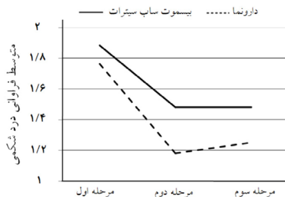
نمودار- ۱: کاهش فراوانی درد شکمی در طول مطالعه به تفکیک در دو گروه

سندرم روده تحریک‌پذیر با ارجحیت نسبی علامت یبوست، البته تعدادی از این بیماران را نمی‌توان در هیچ کدام از این دو گروه تقسیم کرد، به طوری که در دوره‌ای از زمان علامت اسهال و در دوره‌های دیگر علامت یبوست غالب می‌شود. در این بیماری علاوه بر درد شکمی علائم گوارشی دیگر مثل احساس نفخ شکمی، آروغ زدن اغلب به طور شایع دیده می‌شود هر چند که برای تشخیص بیماری وجود آنها الزامی نیست. ۴-۱ برای تشخیص این بیماری در اکثر مطالعات از معیارهای Rome استفاده شده بود که ما نیز در مطالعه خود از آخرین معیاری موجود Rome یعنی Rome III استفاده کردیم. پاتوژنز احتمالی این بیماری به طور کامل شناخته شده نیست ولی علتی که در مطالعات اخیر به آن توجه بیشتری شده است تغییر در فلور میکروبی طبیعی دستگاه گوارش می‌باشد. ۵ به علاوه مطالعاتی نیز وجود دارند که نشان می‌دهند درمان کوتاه‌مدت با آنتی‌بیوتیک منجر به بهبودی قابل توجهی در علائم گوارشی این بیماران شده است. ۶ بنابراین ما نیز در این مطالعه اثر آنتی‌بیوتیک غیرقابل جذب بیسموت ساب‌سیترات را در گروهی از این بیماران که با علامت ارجح اسهال مراجعه کرده بودند مورد مطالعه قرار داده و اثر آن را با گروه مشابه دیگری که دارونما را دریافت کرده بودند، مقایسه کردیم. ما مطالعه