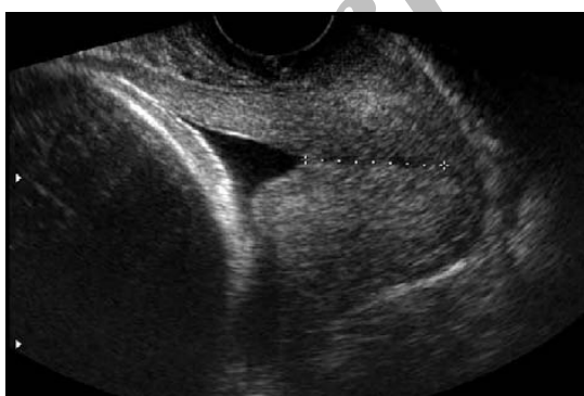
شکل ۵: Funneling سرویکس در سونوگرافی واژینال، غدد دیده نمی‌شود.