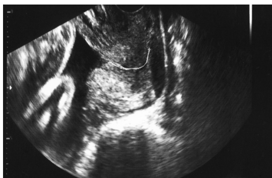
شکل ۴: سونوگرافی از مناطق ایزواکو سرویکس