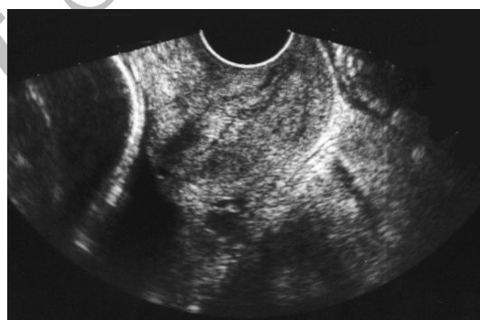
شکل ۲: سونوگرافی از مناطق هیپواکو غدد سرویکس