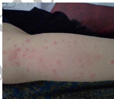
شکل - ۲: ضایعات اندام‌ها

PUPP یا همان پاپول‌ها و پلاک‌های کپیری خارش‌دار حاملگی شایع‌ترین درماتوز دوران بارداری به شمار می‌رود و شیوع آن در حد یک در ۱۶۰ مورد بارداری تخمین زده می‌شود. ۳ اتیولوژی آن هنوز به خوبی شناخته نشده است اما شیوع بالای آن در زایمان‌های اول ۹ احتمالاً نشانگر نوعی دخالت افزایش سریع وزن و کشیدگی جدار شکم و در نتیجه نوعی صدمه بافت همبند و القای یک واکنش افزایش حساسیتی در نتیجه آلرژن‌های رها شده از بافت می‌باشد. ۳،۱۱ تئوری‌های مطرح دیگر افزایش سطح پروژسترون ۱۲ از یک سو و رسوب DNA جنینی در بافت‌های مادری می‌تواند باشد. ۱۱،۱۳ تغییرات هورمونی مانند سطح کاهش یافته کورتیزول ۱۴ در مادر و نیز اختلالات اتوایمونیتیه مربوط به افزایش فعالیت ایمنی رسپتور پروژسترون ۱۵ همگی جزء تئوری‌های مطرح شده می‌باشند. نقش آنتی‌ژن‌های پدری در مواردی نشان داده شده است و می‌تواند به‌عنوان یک عامل بالقوه مطرح باشد. ۱۶،۱۷ تاکنون هیچ‌گونه ارتباطی از