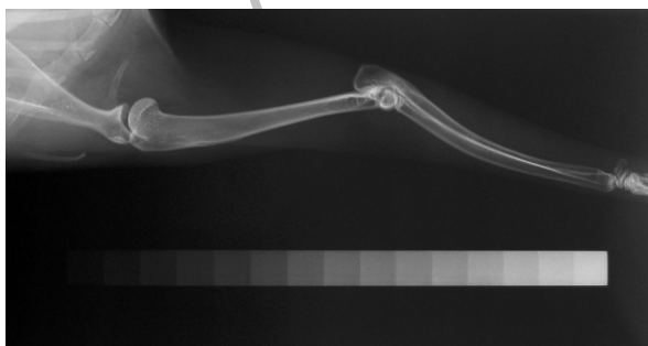
شکل-۱: قرار گرفتن گوه پله‌ای (Step Wedge) در کنار استخوان

از نظر وزن بدن تفاوت معنی‌داری بین گروه‌های آزمایش و کنترل دیده نشد. IGF-I سرم خون در گروه آزمایش و کنترل قبل از تجویز هورمون رشد با هم تفاوت معنی‌داری نداشت ولی IGF-I در گروه آزمایش دو هفته پس از شروع تجویز هورمون رشد به‌طور معنی‌داری نسبت به گروه کنترل افزایش یافت ( P < 0/05 ). قبل از تجویز هورمون رشد غلظت IGF-I سرم خون 222 \pm 51 \text{ ng/l} بود و بعد از دو هفته غلظت سرمی به 270 \pm 64 \text{ ng/l} رسید که حدود ۲۱٪ افزایش نشان می‌دهد. غلظت IGF-I سرم خون در گروه کنترل در ابتدا 273 \pm 83 \text{ ng/l} بود و بعد از دو هفته غلظت سرمی به 272 \pm 102 \text{ ng/l} رسید که نشان دهنده کاهش جزئی IGF-I در این گروه می‌باشد. دانسیته استخوانی در تمام نواحی اندازه‌گیری شده به استثنای اپی‌فیز پایینی استخوان ران افزایش یافت اما دانسیته استخوانی تنها در وسط شفت استخوان ران با گروه کنترل از نظر آماری تفاوت معنی‌داری نشان داد ( P < 0/05 ). دانسیته استخوانی در تمام نواحی اندازه‌گیری شده به استثناء اپی‌فیز پایینی استخوان ران در مرحله دوم (سه هفته پس از تجویز GH) مقداری کاهش یافت، ولی در تمام این نواحی در مراحل بعدی افزایش دانسیته دیده شد (شکل ۲).