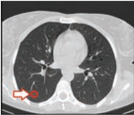
شکل-۱: نمونه‌ای از ندول ریوی

تشخیص بیماری یاری خواهد رساند. ۱ در این مقاله یک سیستم کمک تشخیص جهت شناسایی ندول‌های ریوی با قطر بیش‌تر از ۸mm، پیشنهاد خواهد گردید. کاهش خطای تصمیم‌گیری و خطای مثبت و هم‌چنین افزایش سرعت محاسباتی به عنوان مزیت‌های این روش نسبت به مطالعات قبلی و روش‌های موجود مطرح می‌شوند.