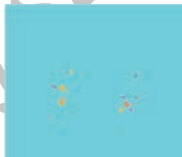
شکل-۴: کدگذاری رنگی نقاط محتمل به ندول

استعمال دخانیات، انتقال عفونت ناشی از افزایش جمعیت جوامع بشری باعث رشد فزاینده بیماری‌های تنفسی و ریوی و به خطر انداختن سلامتی انسان‌ها شده است. پیشگیری، تشخیص به موقع و صحیح بیماری‌های ریوی پس از ابتلا و انجام درمان مناسب، امری بسیار ضروری و حیاتی خواهد بود. تشخیص بیماری‌های ریوی مستلزم دقت و صرف زمان زیاد توسط پزشک متخصص می‌باشد. بدیهی است که خطای انسانی به واسطه تعداد زیاد و پیچیدگی تصاویر در تشخیص و روش درمانی حاصل از تشخیص تاثیرگذار می‌باشد. جهت کاهش خطای انسانی، تسریع در امر تشخیص و افزایش صحت و دقت، سیستمی کامپیوتری جهت کمک به پزشکان در این مقاله ارائه گردید. جهت مقایسه روش پیشنهادی به بررسی مواردی از آخرین پژوهش‌های روز دنیا در این حوزه می‌پردازیم. در مقاله M. Parsa Hoseini که در سال ۲۰۱۱ به ثبت رسیده است، یک سیستم کمک تشخیصی کامپیوتری جهت تشخیص بیماری انسدادی ریوی با استفاده از کلاسیفایر بیزین پیشنهاد شده است. ۱۱ در پژوهشی دیگر از این نویسندگان در سال ۲۰۱۲، تغییرات سطحی و حجمی ساختارهای ریه در گروه‌های سالم و بیمار ریوی با روش‌های شناسایی آماری الگو ارزیابی و مقایسه شده است. ۱۲ نویسندگان مقاله سال ۲۰۱۱ دیگری از ترکیب روش‌های دو بعدی و سه بعدی جهت شناسایی ندول ریوی استفاده کرده‌اند. ۱۳ در این روش خطای مثبت با استفاده از ترکیب نتایج کاهش یافته است. در مطالعه Diciotti روش بخش‌بندی سه بعدی برای استخراج ندول‌های ریوی در تصاویر اسپیرال به