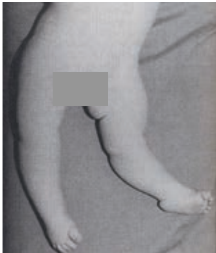
شکل - ۲: دررفتگی مادرزادی زانو