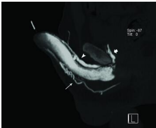
شکل ۱- سی تی کاورنوزوگرافی تکنیک MIP نشانگر نشست وریدی در ورید عمقی پشتی (سرفلش)، نشست ورید یورترال (فلش نازک بلند) و ورید کرورال (Crural) (فلش ضخیم کوتاه).