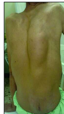
شکل ۱: آقای ۶۱ ساله با شکایت توده در پشت از شش سال قبل با رشد تدریجی