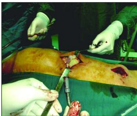
شکل ۳: خارج شدن اسکولکس‌ها در حین جراحی