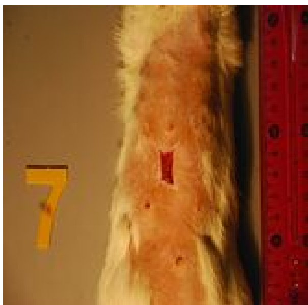
شکل ۳: زخم در روز پانزدهم در گروه آمنیون آسلولار با سلول بنیادی