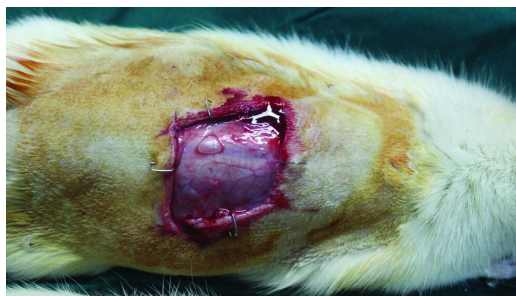
شکل ۲: آمنیون آسلولار با سلول بنیادی مزانشیمی چربی روی زخم