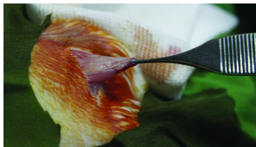
شکل ۱: برداشتن چربی اینگوینال برای تهیه سلول بنیادی