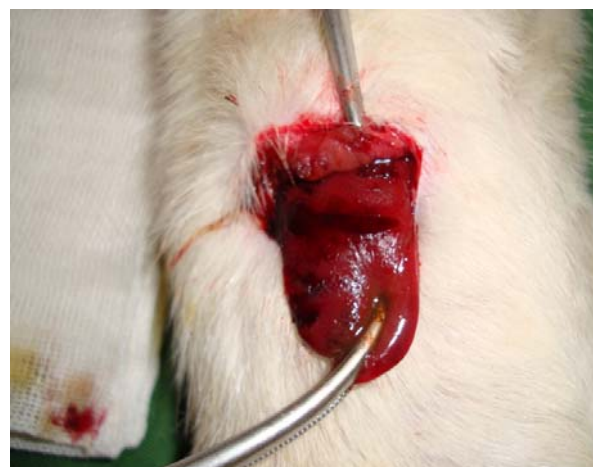
شکل ۲: کنترل خونریزی کبد با استفاده از کلرید آلومینیوم در موش نر ویستار

نتایج به‌دست‌آمده در این مطالعه نشان داد کلرید آلومینیوم در مقایسه با روش استاندارد کنترل خونریزی کبد (استفاده از بخیه) به‌صورت معناداری به زمان کمتری برای کنترل خونریزی نیاز دارد. این ماده هموستاتیک بر خلاف تمامی مواد هموستاتیک شناخته شده،