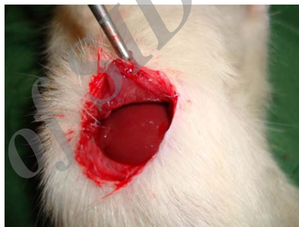
شکل ۱: برش در پوست و زیرجلد برای دسترسی به لوب کبدی در حفره شکمی موش نر ویستار

در هیچ‌یک از گروه‌های مورد مطالعه گرید پاتولوژی صفر، سه، چهار و پنج مشاهده نشد. در تمامی گروه‌های غلظتی ۵٪، ۱۰٪ و ۱۵٪ کلرید آلومینیوم و همچنین گروه کنترل (بخیه) گرید پاتولوژی یک مشاهده شد. در گروه‌های غلظتی ۲۵٪ و ۵۰٪ کلرید آلومینیوم به ترتیب ۷۰٪ و ۹۰٪ گرید پاتولوژی دو مشاهده شد (جدول ۲).