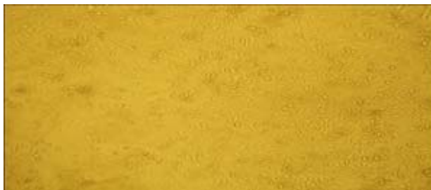
شکل ۱: مورفولوژی سلول‌های استرومال مغز استخوان موش در پاساز سوم کشت

حداکثر ضخامت بافت جوانه‌ای در گروه درمان سلولی در روز هفت و در گروه کنترل با هفت روز تأخیر در روز ۱۴ شکل گرفت و پس از آن روند شروع کاهش ضخامت بافت جوانه‌ای در گروه درمان سلولی از روز هفت و در گروه کنترل از روز ۱۴ بود (جدول ۱). در ادامه کمترین ضخامت بافت جوانه‌ای (جمع شدن زخم) در روز ۲۱ و در گروه درمان سلولی مشاهده شد. بر پایه جدول ۱، اختلاف در ضخامت بافت جوانه‌ای در دو گروه درمان سلولی و کنترل در هر سه مقطع زمانی از لحاظ آماری تفاوت معناداری را نشان داد