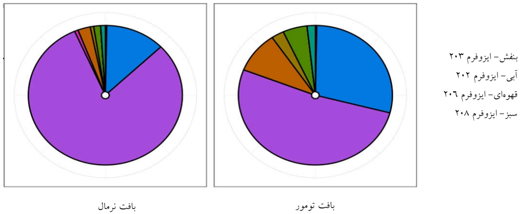
شکل ۲: ایزو فرم‌های بیان شده ژن FGFR3 در بافت تومور و نرمال مثانه