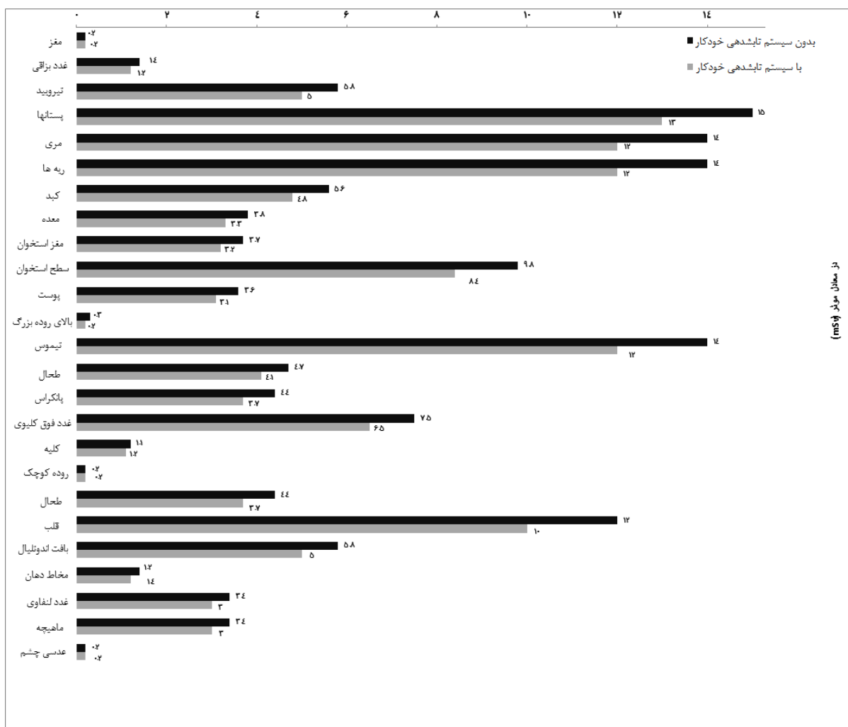
نمودار ۲: مقایسه دوز در اندام‌های مختلف در دو پروتکل با و بدون سیستم کنترل خودکار تابش دهی

گردنی گزارش شده است. ۲۰ Brisse و همکاران مطالعه‌ای تجربی با استفاده از فانتوم استاندارد بر روی آزمون‌های مختلف سی تی اسکن اطفال انجام دادند. در این مطالعه دوز ارگان‌های مختلف در دو حالت با و بدون سیستم کنترل خودکار تابش دهی برآورد و با هم مقایسه شد. ۲۱ نتایج این پژوهش نشان می‌دهد استفاده از سیستم کنترل خودکار تابش دهی باعث کاهش دوز در اندام‌های تیروئید (از ۶۱٪ به ۳۱٪)، ریه (از ۳۷٪ به ۲۱٪)،