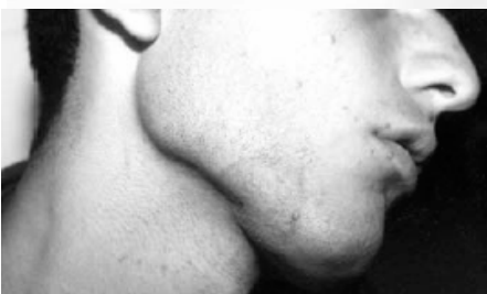
شکل ۱- تینه آ گلاادیاتوروم ایجاد شده به وسیله ترایکوفایتون تونسورانس در کشتی‌گیران

جنس ترایکوفایتون‌ها ایجاد می‌شود. قارچ معمولاً ضایعه‌ای با مرکز روشن و حاشیه مشخص، پوسته‌دار و خشن ایجاد می‌کند. ضایعات از نظر اندازه متغیر و از ضایعات گرد بسیار کوچک تا بزرگ را تشکیل می‌دهند. هدف از این بررسی تعیین میزان شیوع کچلی بدن ورزشکاران و شناسایی عوامل ایجادکننده درماتوفیتی و سایر عوامل مربوط به آن در باشگاههای کشتی در تهران بود.