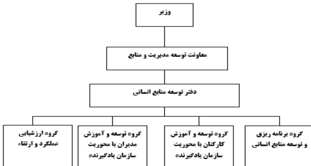
نمودار ۳- ساختار دفتر توسعه منابع انسانی