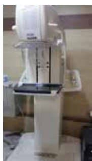
شکل ۲: دستگاه ماموگرافی دیجیتال Planmed

همچنین در این مطالعه از دستگاه تصویربرداری ماموگرافی دیجیتالی مدل Brestige ساخت شرکت MEDI FUTURE ۷ کشور کره جنوبی نیز استفاده شد. تصویر دستگاه ماموگرافی برستیج را در شکل زیر مشاهده می‌کنید (شکل شماره ۳).