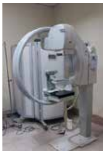
شکل ۱: دستگاه ماموگرافی معمولی مدل Giatto image

دستگاه‌های ماموگرافی استفاده شده در این مطالعه از نوع دیجیتالی و معمولی بودند که نوع معمولی آن با برند Giotto Image ساخت کارخانه IMS ۶ کشور ایتالیا و Palanmed است که تصویر آن را در شکل شماره ۱ مشاهده می‌کنید (IMS company).