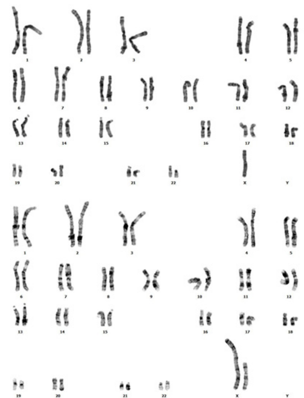
شکل دوم: کاریوتایپ مربوط به بیمار دوم (40%) X dic/46, X (60%) X 45. این بیمار نیز به صورت موزائیک ترکیبی از سلول های حاوی یک کروموزوم X (تصویر بالا) و ایزودیستریک X (تصویر پایین) است.

بررسی همبستگی های ژنوتیپ- فنوتیپ در این بیماران نشان می دهد که فنوتیپ کامل این بیماری اغلب در بیماران با کاریوتایپ غیرموزائیک مشاهده شده و در بیماران با بازآرایی های کروموزوم X می توانند فنوتیپ کامل یا جزئی ترنر را نشان دهند. با این حال، به دلیل غیرفعال بودن ترجیحی X غیر طبیعی، ناهنجاری های مرتبط با نوع موزائیک به طور کلی تحمل شده و می توانند حداقل تا حدودی منجر به فنوتیپ شود (۹-۱۱).